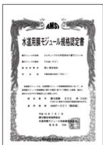
▲水道用膜モジュール規格認定書