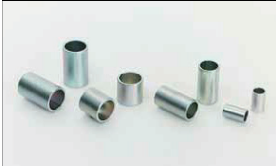
電気亜鉛メッキ(三価クロム品)