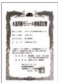
▲水道用膜モジュール規格認定書